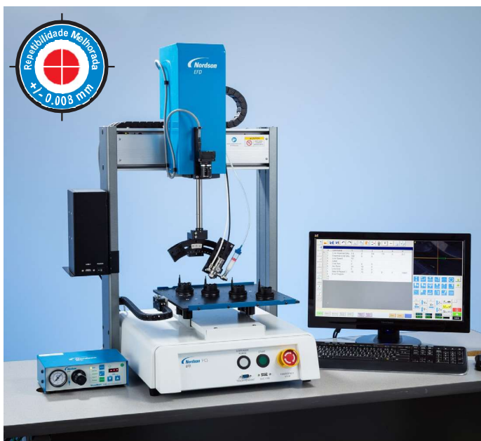
A Série RV torna a dosificação automatizada a 4 eixos mais intuitiva com o respetivo software DispenseMotion proprietário.

Automatização de 4 eixos facilitada para uma aplicação de fluidos com precisão, com smart vision