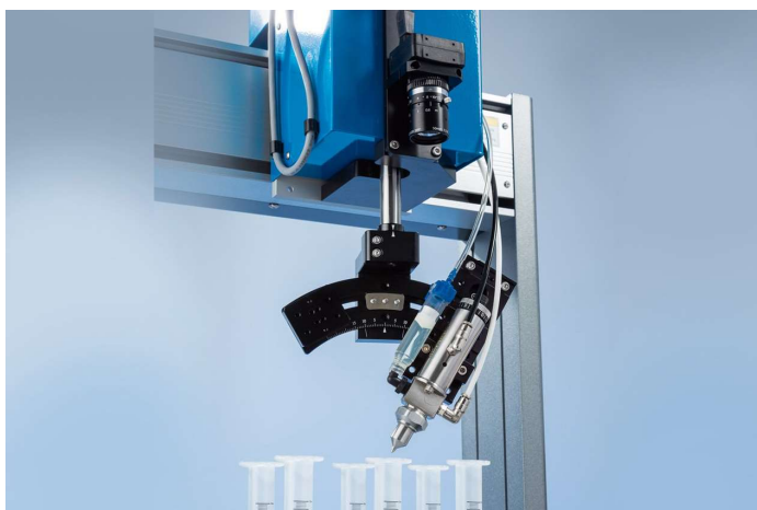
A câmara CCD smart vision verifica a presença e a orientação da peça.

Os sistemas 4 - Eixos automatizados da Série RV da Nordson EFD estão configurados para dosificação precisa de fluidos utilizando sistemas de cilindro de seringa EFD e de válvula.